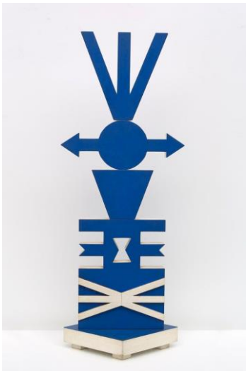
Rubem Valentim Escultura-78, 1978 madeira policromada 102 x 40 x 5 cm