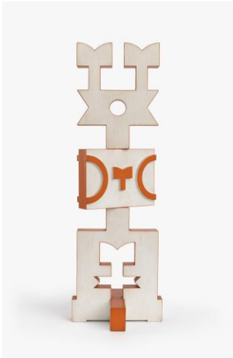
Rubem Valentim Sem título, 1978 madeira policromada 96 x 31 x 5 cm