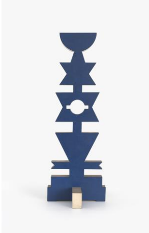
Rubem Valentim Objeto 1978 acrílica sobre madeira 92 x 32 x 32 cm